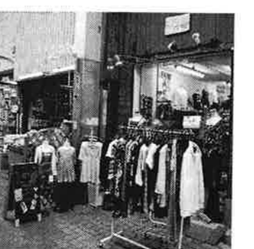
9 レーヴ / 子供服もあるレディースショップ。少し派手めな感じ。