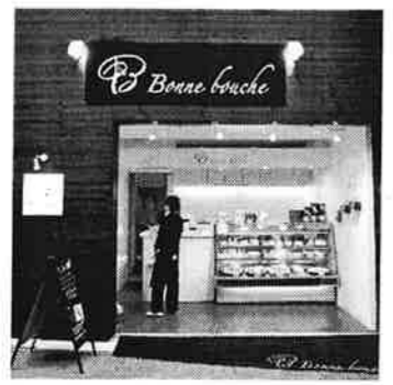
12 ボンヌブーシュ / まわりの雰囲気とはとても対照的なシックなケーキ屋さん。