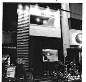
1 カネトン / ホテル・ニューオータニ「サクラ」出身のシェフとソムリエのフランス料理。