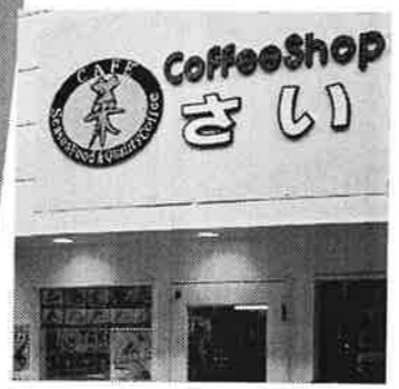
6 カフェ菜 / ランチにもオススメのコーヒーショップでテイクアウトも豊富。