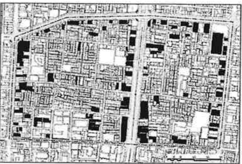
現在の「7階建て以上の建物」(工事中の建物も含む)