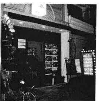
10 やき丸 / 韓国料理の店。キムチなど店頭販売もあります。食堂のよう。