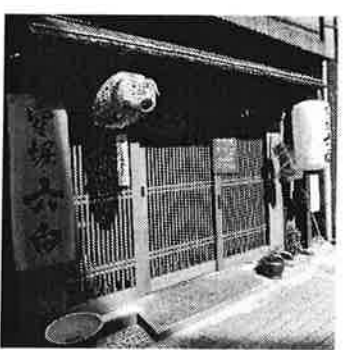
4 空堀六白 / 陶製(?)のかっこいい「ふた」が目印の宮崎産霧島黒豚の専門店。