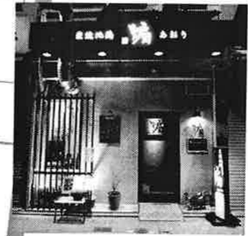
3 燗 / 谷町筋沿いにできたおしゃれな焼き鳥屋さん。お塩にヒミツがあるとが。