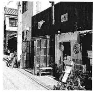
13 宝や / 御屋敷再生複合ショップの中にできたご焼き屋さん。