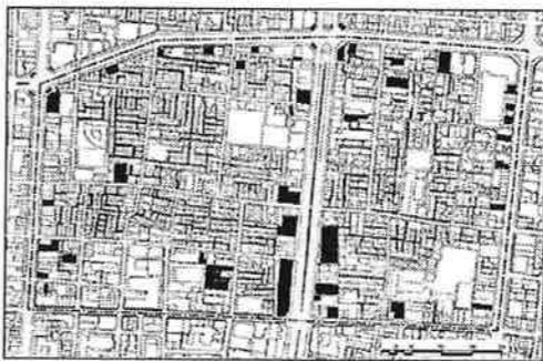
10年前の「7階建て以上の建物」