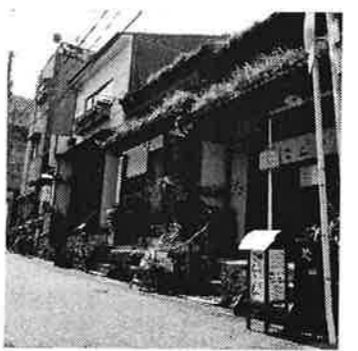
11 いなり家こんこん、金甌屋、ベジグリーンフィンガーズ、itten、Low / などができました。