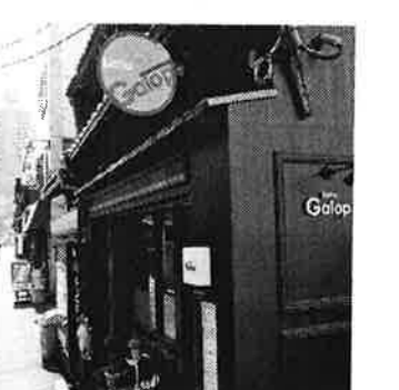
7 ピストロギャロ / 気軽な雰囲気フランス料理店。中に入ると落ち着く、隠れ家のよう。