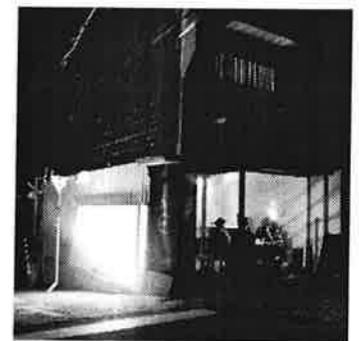
2 ナツキッチンカフェ / 熊野街道曲がり角にできたまるでまちの灯籠のような店。