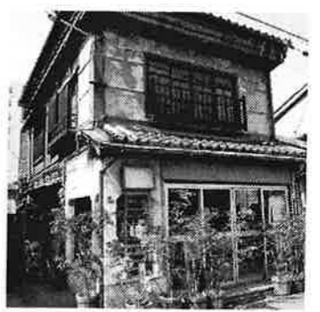
5 空堀モスリン / 見過ごしてしまいそうな古着屋さんで、2階はカフェ(?)です。