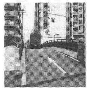
② サロンから北に行くと不思議、川でもないのに橋です