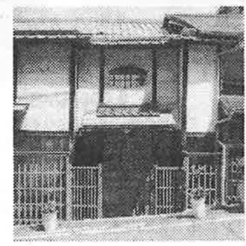
⑦ 商店街の一本南の通りには立派なお屋敷が残っています