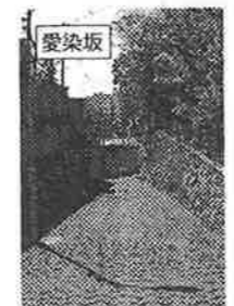
愛染坂の近くに夕陽丘の碑や藤原家隆の塚もある