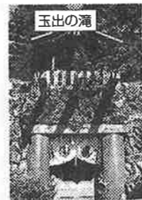
玉出の滝は、京都清水寺の「音羽の滝」を模したものである

前回は松屋町筋の下寺町まで来ました。今回は、私が大阪で一番好きな散策コース、「天王寺七坂巡り」へご案内しましょう。