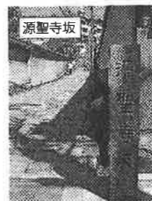
白壁と石畳が美しい源聖寺坂