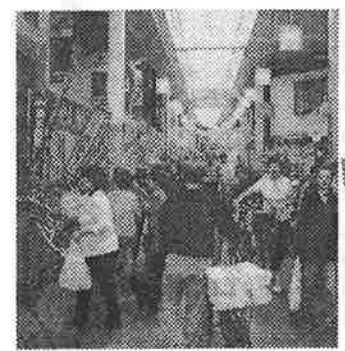
① サロン前のアーケードに入ると買い物客で賑わっています