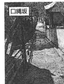
口縄坂の頂上には織田作之助の文学碑もある