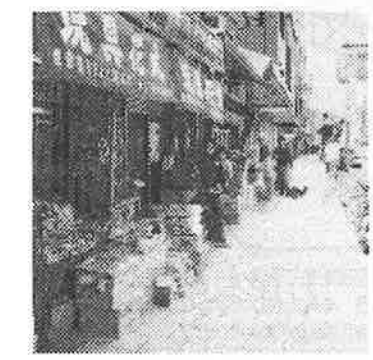
⑤ 松屋町筋はオモチャや人形など楽しいモノずくめです