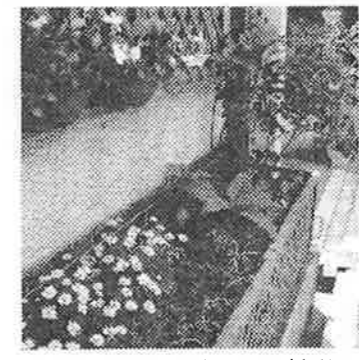
⑨ 軒先に見られる小さなみどりはお散歩の楽しみです